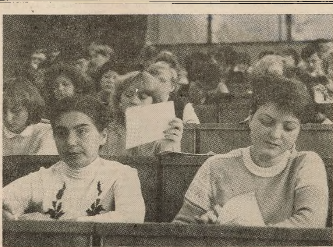
Фотарэпартаж Аляксандра Валшына з гістарычнага факультэта чытайце на 2—3 старонках газеты.

А. ВІНІЧУК , намеснік сакратара камітэта камсамола на ідэалагічнай рабоце.